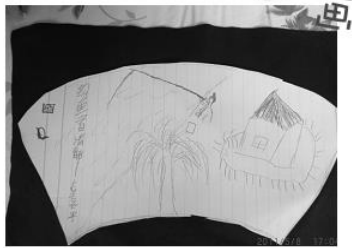
孩子读完丰子恺《爸爸的扇子》后主动创作的扇面作品

在互动式分享阅读中，儿童的表达方式多种多样，说、画、演……只要是孩子喜欢的方式都可以。每一次，孩子们的奇思妙想都会让“大带小”的志愿者们赞叹不已！